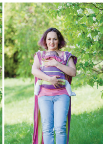
Перекидаємо верхні лямки на плечі