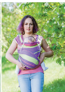
За бажанням можна розправити полотна по спинці, якщо вони широкі