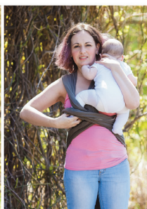
Пропускаємо ніжку крізь полотно та кишеню