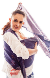
Рівномірно підтягуємо з іншої сторони