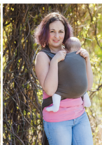
Підтягуємо кишеню на спинку