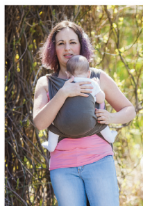
Розправляємо з одного боку полотно