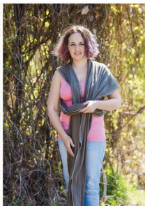
Заправляємо полотно в кишеню