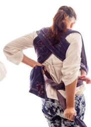
Зав'язуємо подвійний вузол