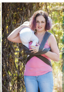
Повторюємо з другою ніжкою