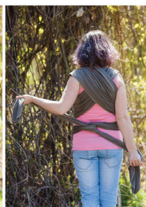
Зав'язуємо слінг на два вузли