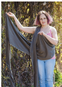
Повторюємо з другим кінцем