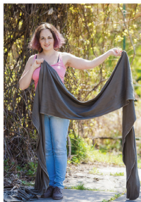
Знаходимо мітку середини