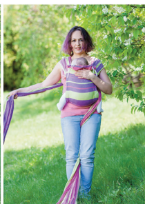
Повторюємо з другою лямкою