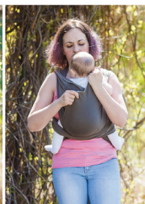
Повторюємо з другого боку