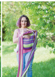
Піднімаємо спинку слінгу