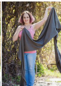
Перекидаємо полотно на протилежне плече