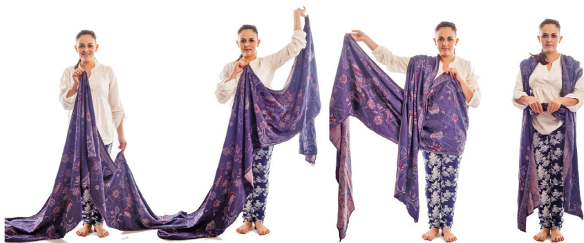
Знаходимо мітку середини