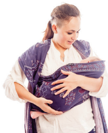
Одягаємо кишеню малюка на спинку