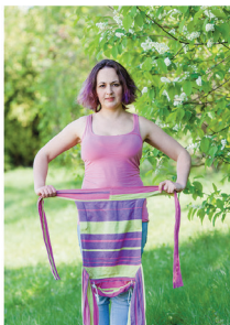
Беремо слінг «догори ногами»