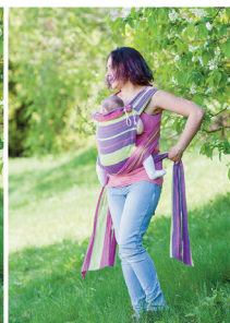
Проводимо лямку під ніжками