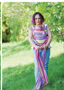
Перехрещуємо лямки під дитиною