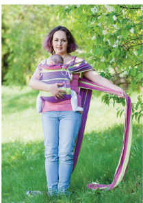
Беремо протилежну лямку і підтягуємо